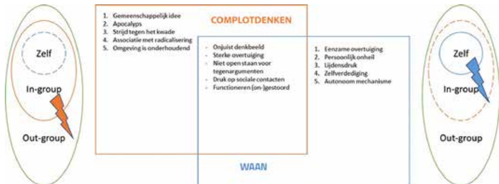
Figuur 1. Verschillen en overeenkomsten tussen complotdenken en wanen

Hoe ontstaan deze idiosyncratische ervaringen? Een klinisch-fenomenologisch model wijst op kwalitatieve veranderingen in de ervaring van de werkelijkheid, waar de inhoud van het denken zich vervolgens naar voegt (Feyaerts e.a. 2021). Subtiele veranderingen kunnen plaatsvinden in zelfbewustzijn, zintuiglijke werkelijk-